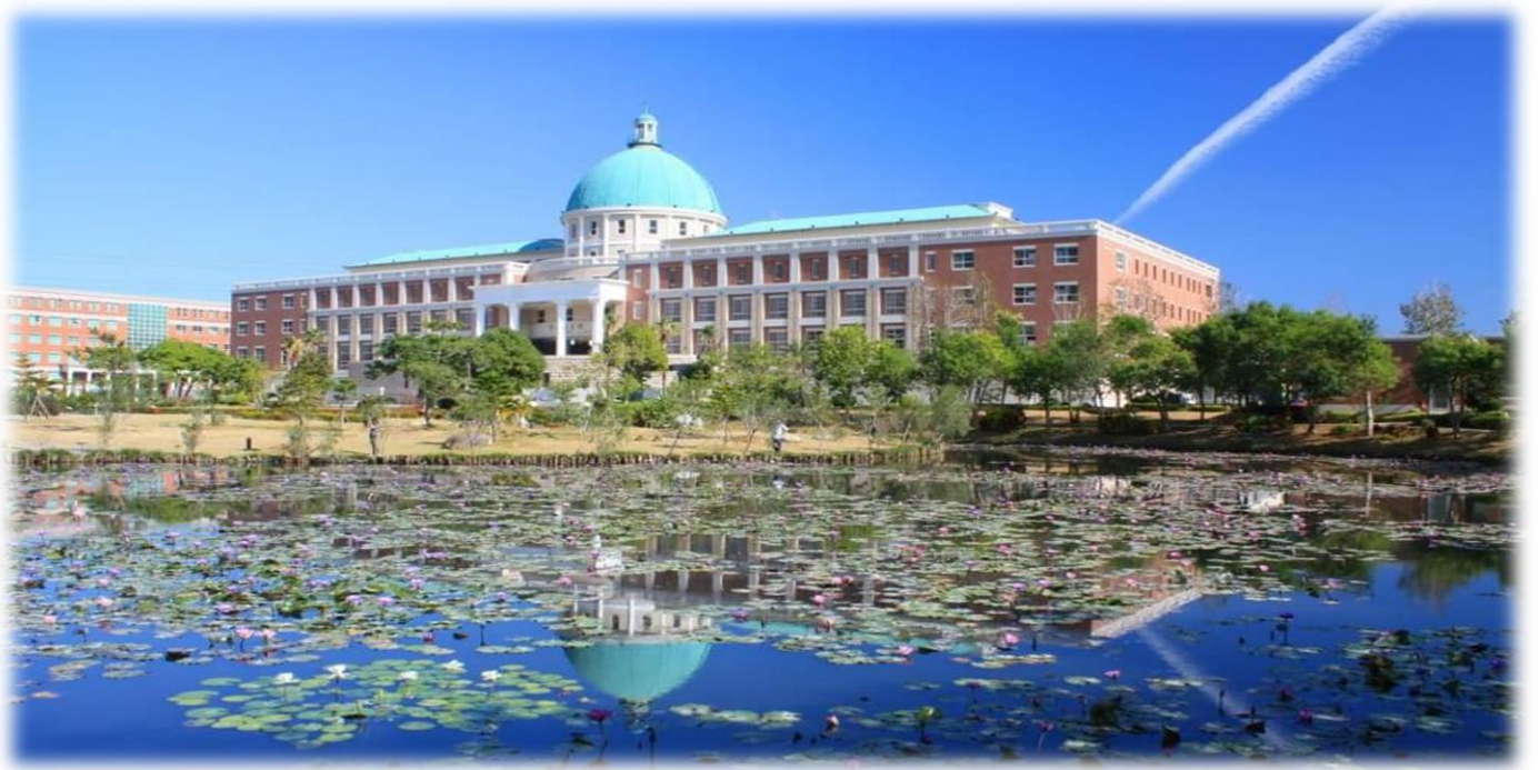
圖：就讀亞大，就是就讀一所「綜合大學」+「醫學大學」+「國際大學」