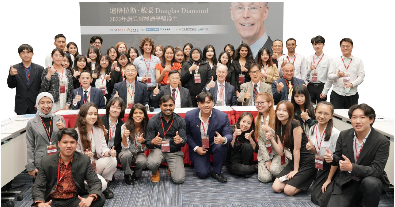
圖：禮聘多位國際級大師蒞校講學，師生可親自向大師請益!每年定期邀請諾貝爾得獎者舉辦大師論壇。