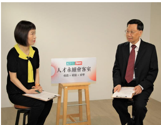
圖：亞洲大學校長蔡進發，接受天下 Cheers 人才會客室專訪。