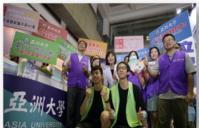
圖：招生處行政團隊參加大學博覽會