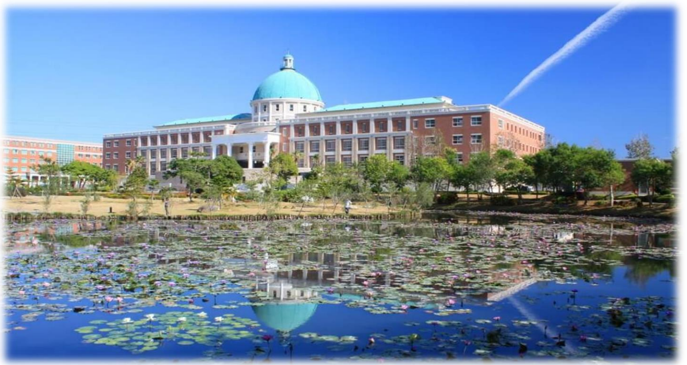
圖：就讀亞大，宛如就讀一所「綜合大學」+「醫學大學」+「國際大學」