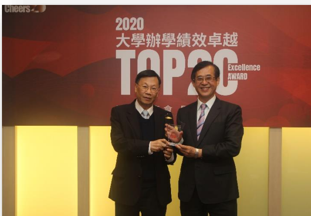
圖：大學辦學績效 TOP20，全台第 9 名！