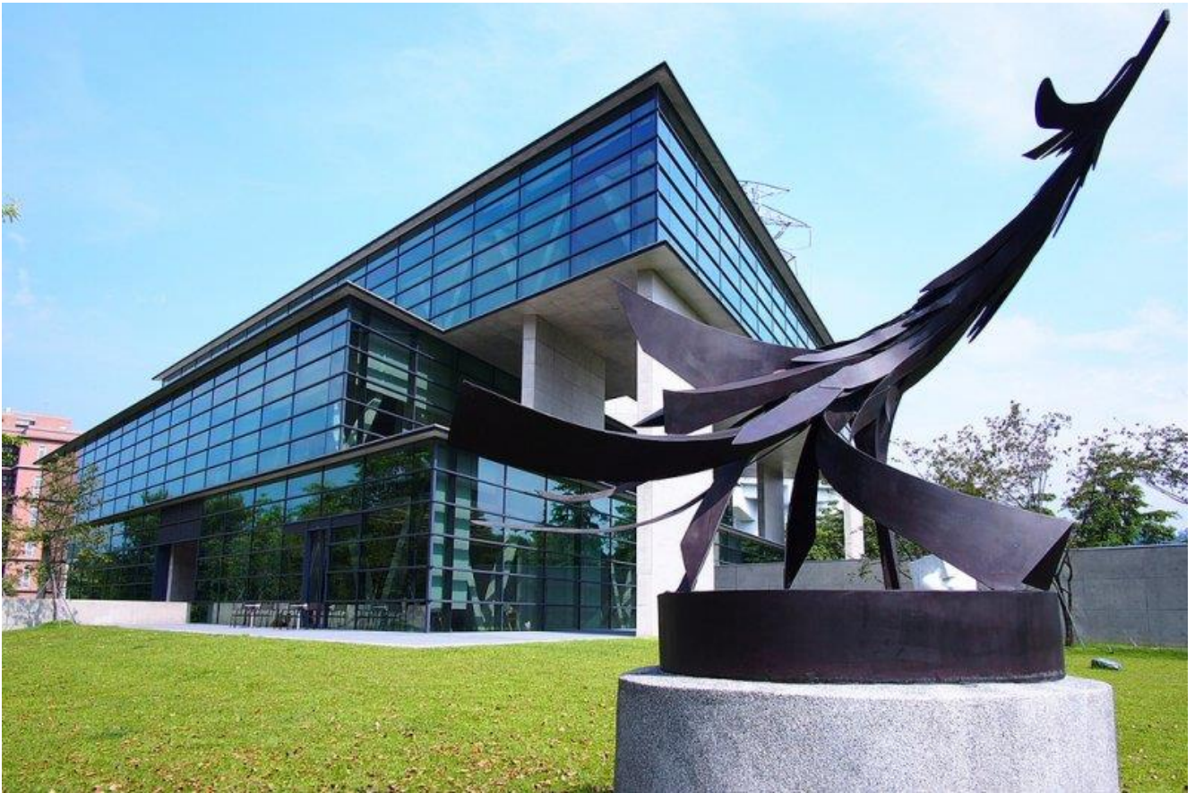
圖：中國時報舉辦「大專校院校園風景網路人氣票選」亞大安藤美術館入選全台校園十大美景！