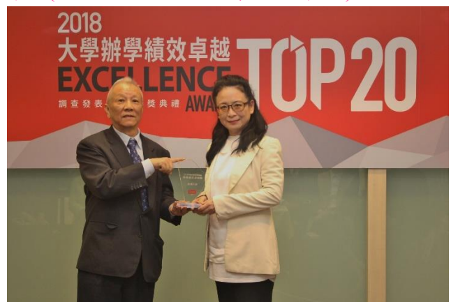
(圖：大學辦學績效 TOP20，亞大全台第 6 名！)

校址：台中市霧峰區柳豐路 500 號 招生諮詢專線：04-23323456#3132~3135 網址： http://rd.asia.edu.tw